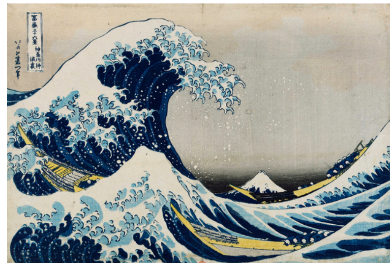
Hokusai Katsushika, La Grande Vague de Kanagawa , vers 1829 – 1834