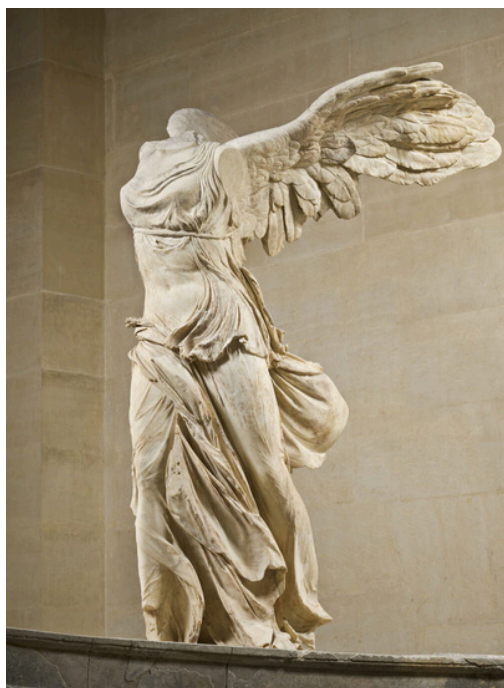
Victoire de Samothrace, -200 / -175 (1er quart IIe s. av. J.-C.)