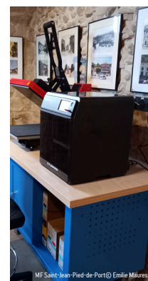
MF Saint-Jean-Pied-de-Port