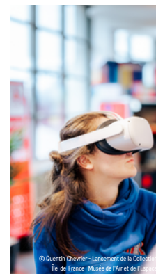
Lancement de la Collection Ile-de-France - Musée de l'Air et de l'Espace