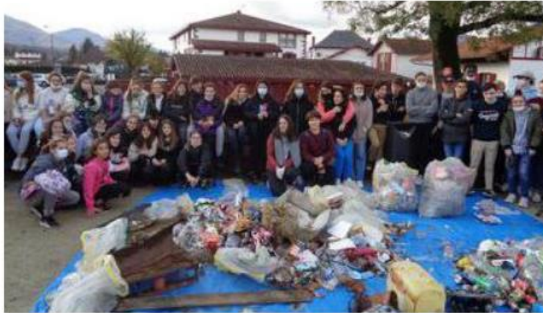
L'opération ramassage de déchets avec les scolaires avait été un réel succès l'an dernier.

Coordonnée par la Communauté d'agglomération Pays basque, la semaine Klima, du 9 au 15 octobre, est un temps fort de mobilisation des collectivités, administrations, écoles, entreprises du Pays basque pour « agir ensemble et maintenant pour le climat au Pays basque ». Dans cette optique, la commune de Saint-Jean-Pied-de-Port et le comité de pilotage Agenda 30 organisent la semaine Klima de Garazi.